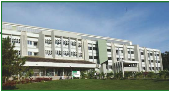
Nuevo edificio de Química.