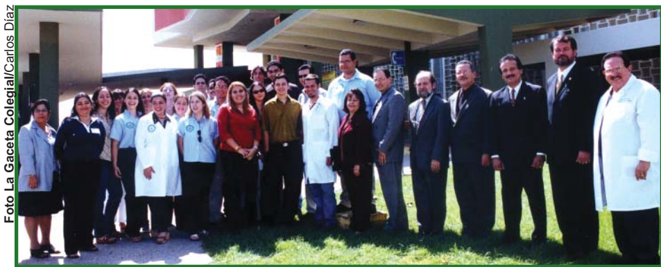
El Centro Médico de Mayagüez es la sede del programa de internado subgraduado en cirugía cardiovascular para estudiantes de biología del RUM.