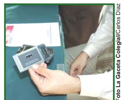
El WCN utiliza 70 tarjetas de conexión que ya se están prestando a la comunidad universitaria.

Para obtener más información sobre el proyecto WCN puede visitar la dirección http://wireless.uprm.edu . ■