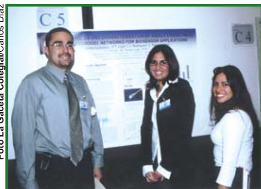
Varios estudiantes de Biotecnología del RUM presentaron sus proyectos durante el primer Congreso Latinoamericano y del Caribe de Biotecnología.