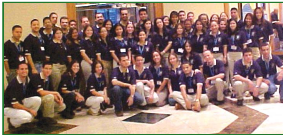
La delegación del RUM fue la más numerosa de la competencia.

Entre los temas que se trataron estuvieron retos en el área de biotecnología farmacéutica, innovaciones económicas a través de la investigación y el currículo académico, y la empresa. También se habló